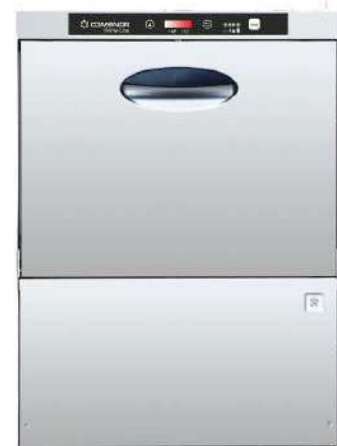
Ersatz Geschirrspüler (Untertischspülmaschine)

Im Berichtsjahr lag der Fokus wiederum hauptsächlich bei den gewohnten und notwendigen Unterhalts- und Reparaturarbeiten. Aus Sicherheitsgründen musste an den grossen Eichen bei der Kirche ein Kronenschnitt ausgeführt werden. Die beiden „alten“ Schweinwerfer der Kirchturmbeleuchtung mussten infolge eines Defekts durch ein neueres und energieeffizienteres (LED) Modell ersetzt werden. Der Geschirrspüler in der Küche vom Kirchensaal konnte nicht mehr repariert werden (keine Ersatzteile mehr lieferbar) und musste zwangsläufig ausgetauscht werden. Am Entfeuchtungsgerät in der Kirche (für die Orgel) musste ebenfalls Reparaturarbeiten ausgeführt werden. Am Pfarrhaus mussten zudem 2 Ganzmetallstoren ausgetauscht werden.