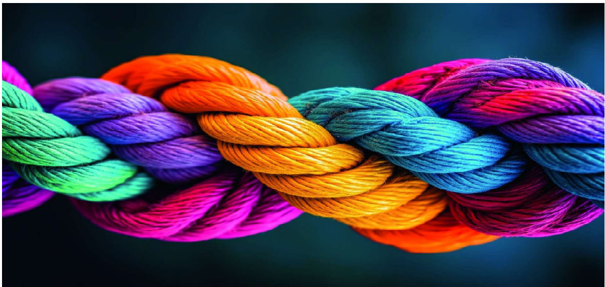
Grafik und Idee aus dem Fusionsprozess Ref. Kirche Limmattal

Unsere einzelnen Teams der jeweiligen Kirchgemeinden Muhen, Kölliken, Rued und Schöftland sind wie einzelne Seile. Sie vertreten sich schon länger in den Pfarrämtern, aber auch gemeinsame Gottesdienste werden organisiert und gefeiert und unsere Jugend ist in den verschiedenen Kirchgemeinden unterwegs, besucht die gegenseitigen Angebote von Jugendgottesdiensten oder gemeinsamen Ausflügen.